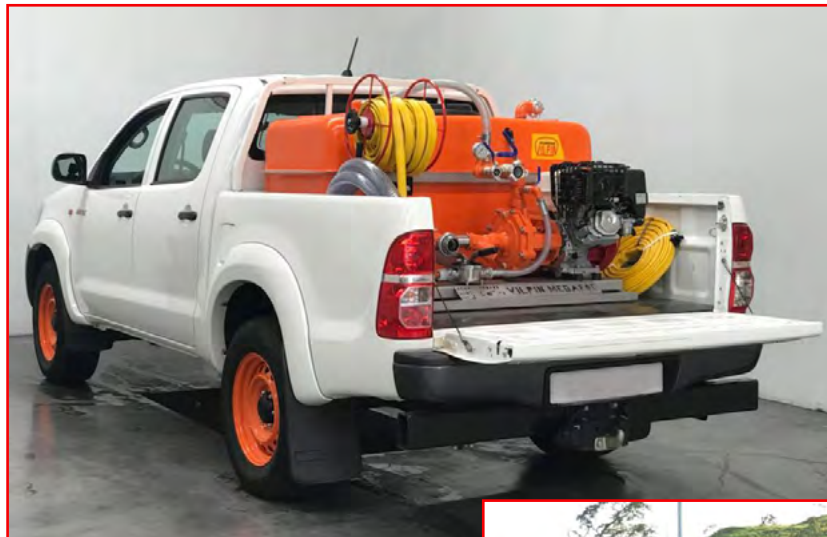
Depósito 600 litros Poliester