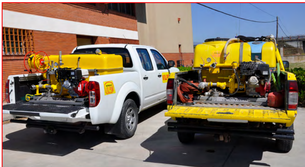
Depósito 600 litros Poliester