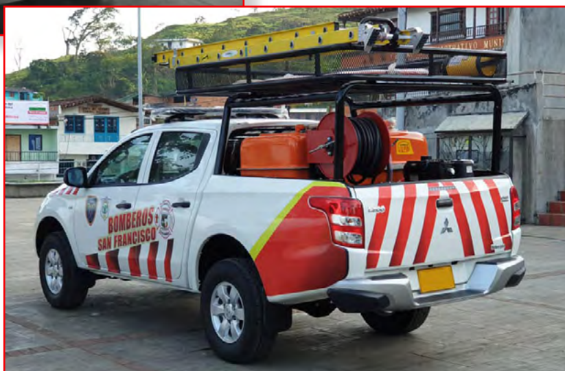
Depósito 600 litros Poliester