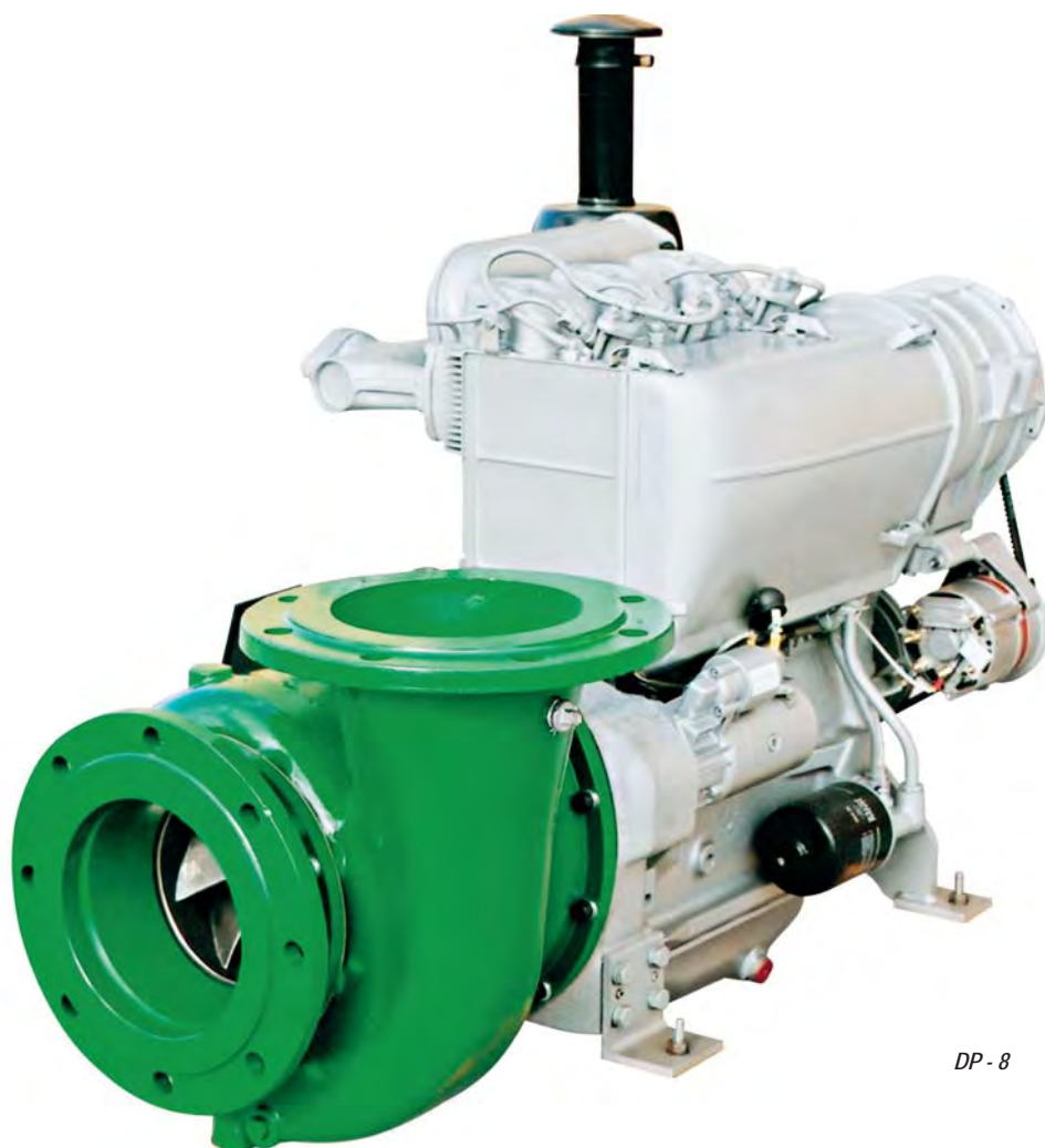
DP - 8